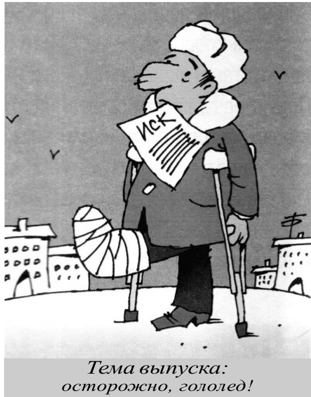
Тема выпуска: осторожно, гололед!

По материалам журнала «Спрос» подготовил С. СЕРГЕЕВ.